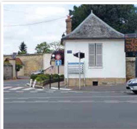
Le Pavillon Napoléon (rue de Milly) sera rénové en 2016.

L'agriculture francilienne bénéficie de terres parmi les plus fertiles d'Europe .