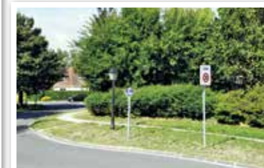
Zone 30 : Secteur Les Bréguet.

Le 19 décembre 2014, le Conseil Municipal a approuvé le Plan de Prévention du Bruit dans l'Environnement (PPBE) qui constitue un plan d'actions, élaboré dans le but de réduire le bruit ou de prévenir son augmentation et de protéger les zones calmes.