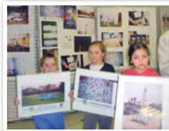
En 2013, les élus du Conseil Municipal des Enfants (CME) expriment, en photos, leur perception des gestes éco-citoyens .