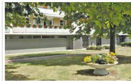
Résidence La Jeannotte.