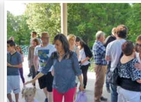
Le personnel de la Ville de Mennecey

En mai 2015, une page du journal ENSEMBLE n°9 a été consacrée à l'article suivant : « Pour protéger la planète, pensez à adopter des gestes éco-citoyens sur votre lieu de travail ! »