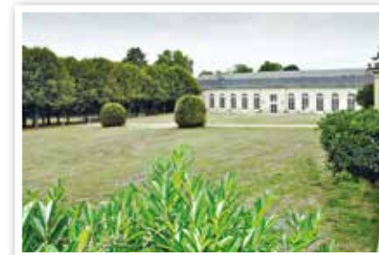
Conservatoire Joël Monier

Le Kiosque Famille est un système de réservation dématérialisé via internet (pour les inscriptions au Centre de Loisirs par exemple)