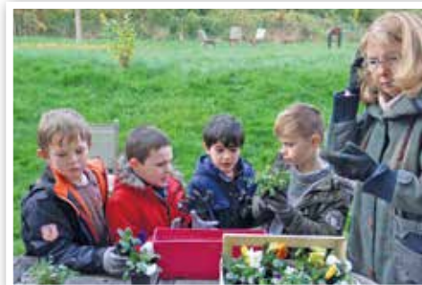
Atelier « nature et jardinage » pour les écoliers initié par les membres de l'association ASEC. Des jardins potagers de 150 m 2 ont été aménagés dans deux groupes scolaires de la ville (Myrtilles et Verville).