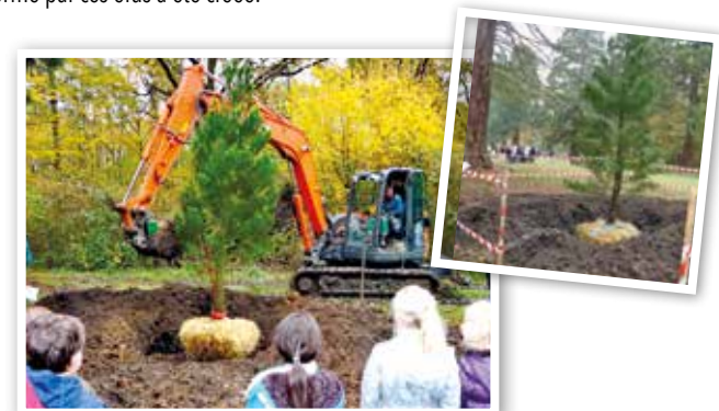
Le 19 novembre 2014, plantation de séquoias au Parc de Villeroy.

Dans le cadre des nouvelles constructions au Rousset, un corridor écologique et une coulée verte seront créés : il est prévu des haies bocagères à petits fruits pour favoriser la biodiversité. Elles sont favorables aux abeilles et insectes pollinisateurs.