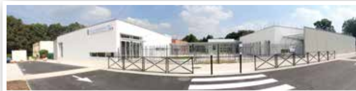
Le groupe scolaire de la Verville respecte les critères de Haute Qualité Environnementale (HQE).