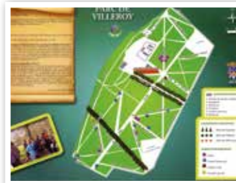
En 2014, ils travaillent sur la biodiversité à travers la découverte et la gestion du Parc de Villeroy. Une carte du Parc choisie et mise en forme par ces élus a été créée.