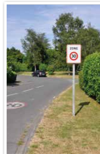
Zone 30 : Secteur La Verville.