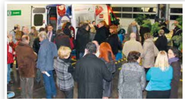
Inauguration de la navette du CCAS en mars 2015.

A Mennecy, la programmation culturelle ne propose pas moins de 26 spectacles par an dans différents domaines.