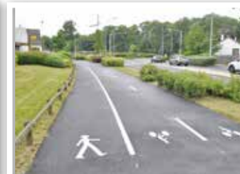
Avenue Charles de Gaulle.