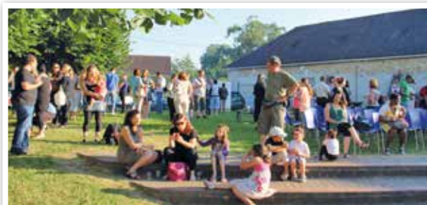
Fête au Centre de Loisirs.

Le Kiosque Famille est un système de réservation dématérialisé via internet (pour les inscriptions au Centre de Loisirs par exemple)