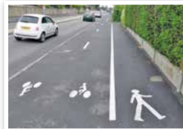
Avenue Charles de Gaulle.