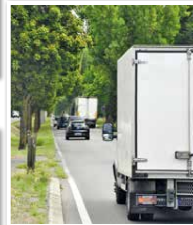
Camions sur la RD 191 (près de la piscine).

Des « zones 30 » : Route de Chevannes, à l'intersection avec la rue des Écrennes et la rue des Mélèzes, la Résidence des Villas de Milly, rue de la Fontaine, rue Canoville, rue du Clos Renault, rue de l'Ormeteau, rue du Petit Mennecy, Les Bréguet, La Verville.