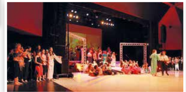
La Comédie Musicale.