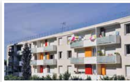
Résidence Les Châtrees réhabilitée.