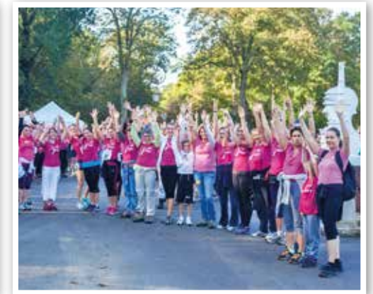
Octobre Rose 2014. Les participants ont couru ou marché contre le cancer du sein à l'initiative du Lions Club.

La Résidence « Maison de Famille - Les Etangs » est un établissement d'hébergement pour personnes âgées dépendantes (EHPAD). Elle participe aux événements de la commune de Mennecy : visites culturelles, spectacles... d'autres projets avec la Commune sont en cours de réflexion.