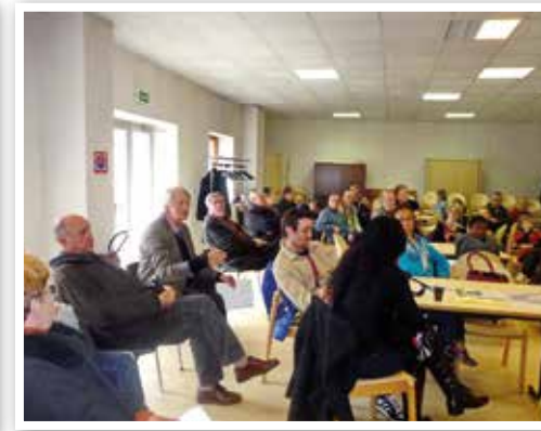
Ateliers participatifs lors de la démarche Agenda 21.

Notre tissu associatif local est fort de 120 associations comptabilisant environ 15 600 adhérents (plus que le nombre d'habitants !).