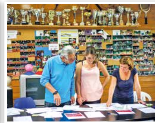
Forum des associations, mobilisation des scouts et des bénévoles associatifs.