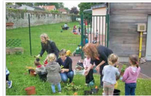
Initiation au jardinage pour les tout-petits proposée par le relais assistantes maternelles (RAM).