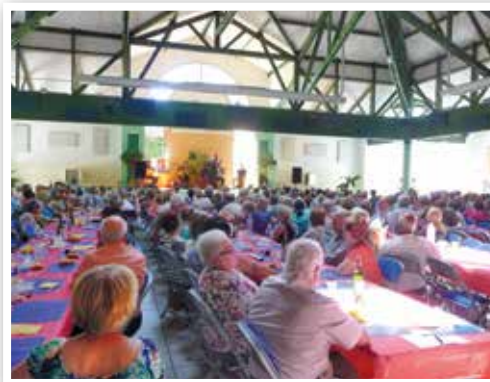
Barbecue du CCAS - Musique et danses gitanes (été 2015).