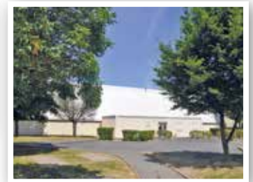
Gymnase Maurice Nivot.

Les lampadaires sur la voie publique sont éteints chaque nuit de 00 h 45 à 5 h 00. Depuis 2011, un tiers des candélabres du secteur des Levitt sont munis d'un système réduisant l'intensité de la lumière la nuit.