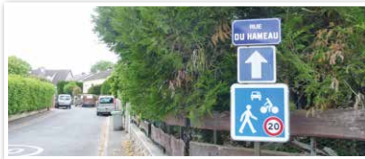
Zone de rencontre, rue du Hameau.

L'implantation d'un VELIGO ( stationnement sécurisé ) pour une quinzaine de vélos est prévue en 2017. Le service sera ouvert à tous les voyageurs des transports en commun franciliens détenteurs d'une carte Navigo.