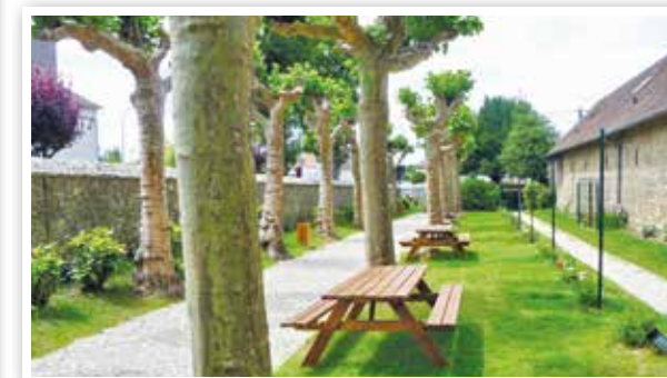
Aménagement de la Roseraie (rue de Milly)