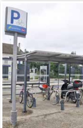
Station pour garer les 2 roues à la gare SNCF.