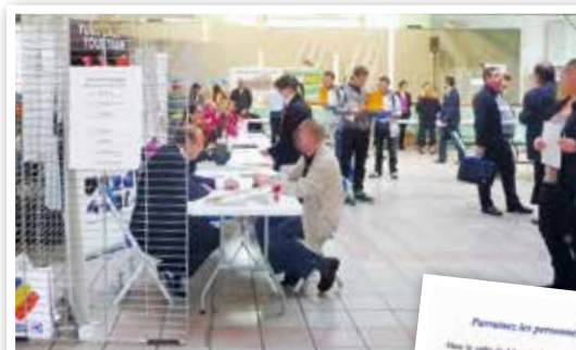
Premier salon de l'emploi de Mennecy.

Un Club de parrainage des personnes à la recherche d'emploi est en cours de création.