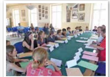
En Mairie, le Conseil Municipal des Enfants en séance .