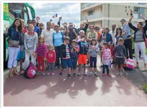
Opération « Une journée à la mer pour 1 euro ».