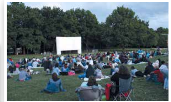
Parc de Villeroy juillet 2015 - Séance de cinéma en plein air, animation initiée par le Conseil Municipal des Enfants (CME) en 2012.