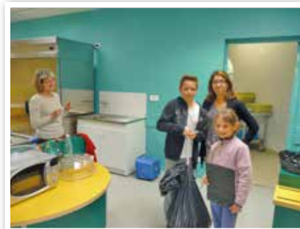
Le CME réalise en 2015 une enquête dans les écoles élémentaires de Mennecey sur le gaspillage alimentaire .