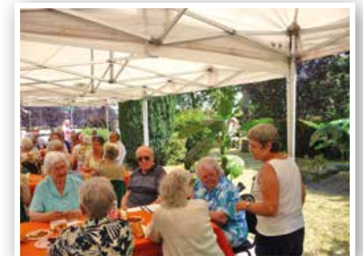
Barbecue de la Résidence Gauraz.

« Lire et Faire Lire » est une démarche axée sur le plaisir de lire et la rencontre entre les générations. La commune, en convention avec l'association départementale « Lire et Faire Lire », sollicite des retraités bénévoles pour faire la lecture aux écoliers du primaire, sur le temps de cantine.