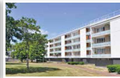
Résidence La Jeannotte réhabilitée.

Les réhabilitations réalisées en 2013 par le bailleur Essonne Habitat, soutenues dans le cadre d'un éco-prêt de la Caisse des Dépôts garanti par la Commune, ont pour objectif de réduire les consommations énergétiques d'au moins 60%. Les locataires ont reçu un livret d'information sur les bonnes pratiques environnementales et d'entretien.