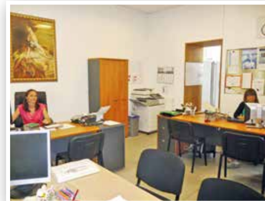
Service de l'état civil au Centre administratif Jacques Broz

Et en 2013, un Plan d'Accessibilité de la Voirie et des Espaces Publics a été élaboré.